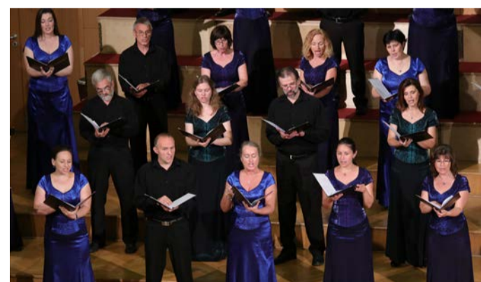
Egyesével énekelnek mostanában a vegyeskar tagjai

gatója. - A Cantemus Gyermekkar és a Pro Musica Leánykar tagjai kottát kaptak, amit otthon maguk tanulnak meg a távsegítségemmel. Fontos énekelteni őket, hogy szinten tartsuk tudásukat. Hogy ez a hosszú szünet mennyire ártott a közös éneklésnek, az majd akkor derül ki, amikor először találkozom újra a kórustagokkal. MML