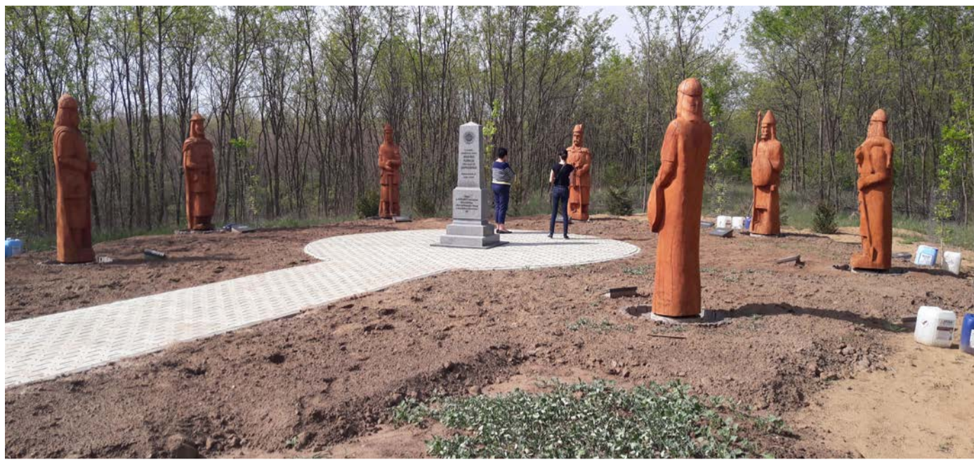
Az emlékhely még nincs teljesen készen, de már sok érdeklődő felkeresi a Geszteréd közeli erdőben